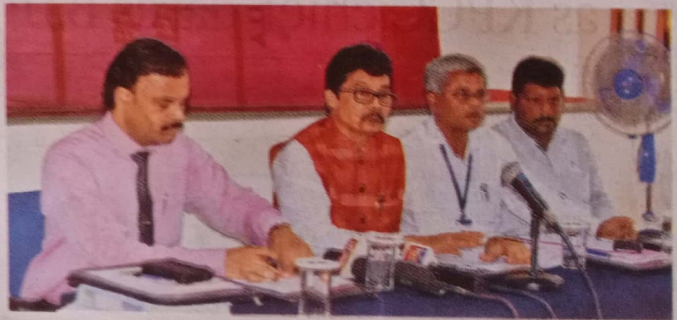
Mangalore University vice-chancellor Prof. P Subramanya Yadapadithaya addressing a press meet

Out of 6,217 PG students who have passed, boys account for 1,666 (26.80%) and the girls represent 4,551 (73.20%). Similarly, at the UG level, out of 23,561 candidates who passed, 8,798 (37.34%) are boys and